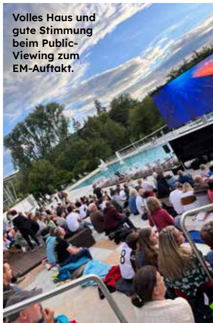
Volles Haus und gute Stimmung beim Public-Viewing zum EM-Auftakt.

Pünktlich zum Beginn des Sommers wurden die Bauarbeiten am Treuchtlinger Freibad fertiggestellt.