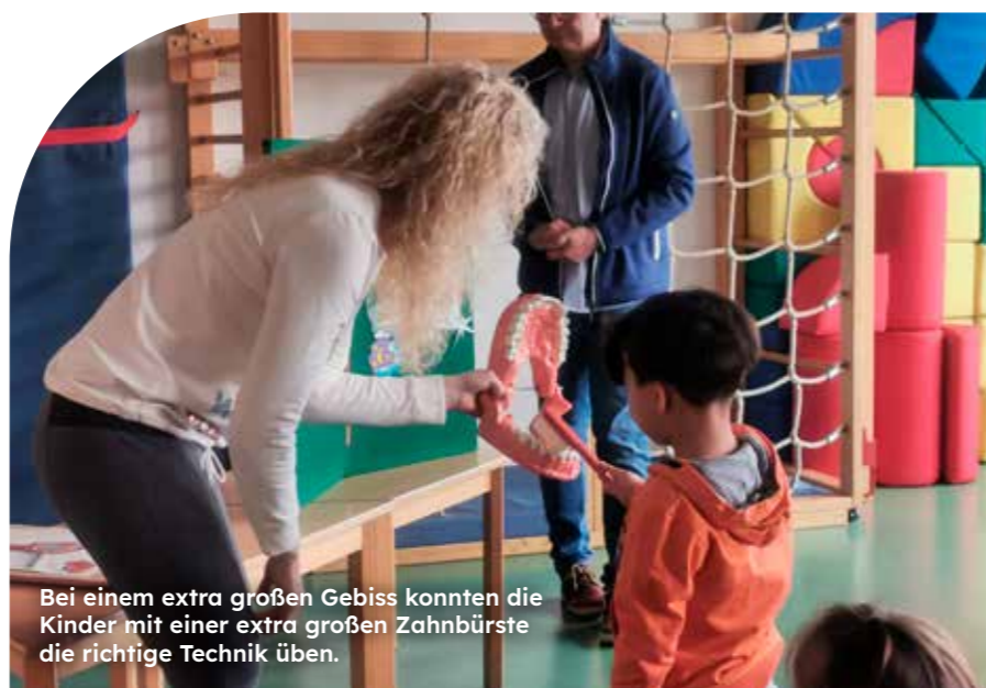
Bei einem extra großen Gebiss konnten die Kinder mit einer extra großen Zahnbürste die richtige Technik üben.