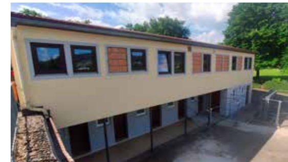
In diesem Trakt befinden sich die Duschen und Umkleidekabinen, die derzeit erneuert werden.