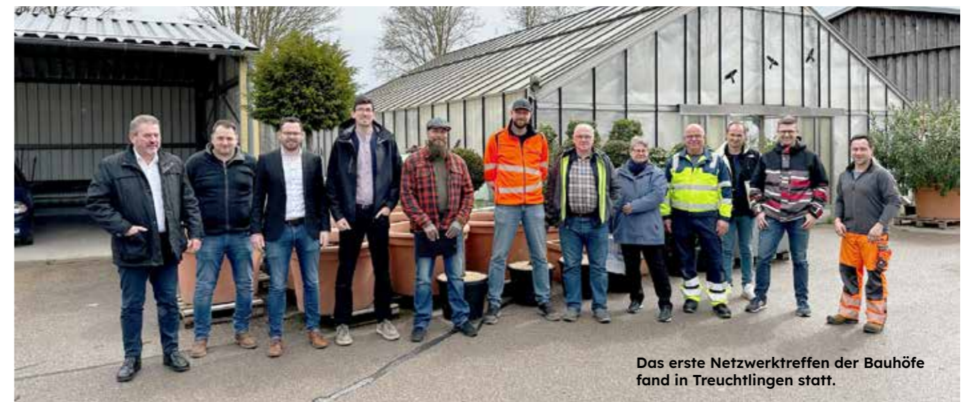
Das erste Netzwerktreffen der Bauhöfe fand in Treuchtlingen statt.

Nach und nach soll ein Netzwerk über die umliegenden Gemeinden ausgedehnt werden.