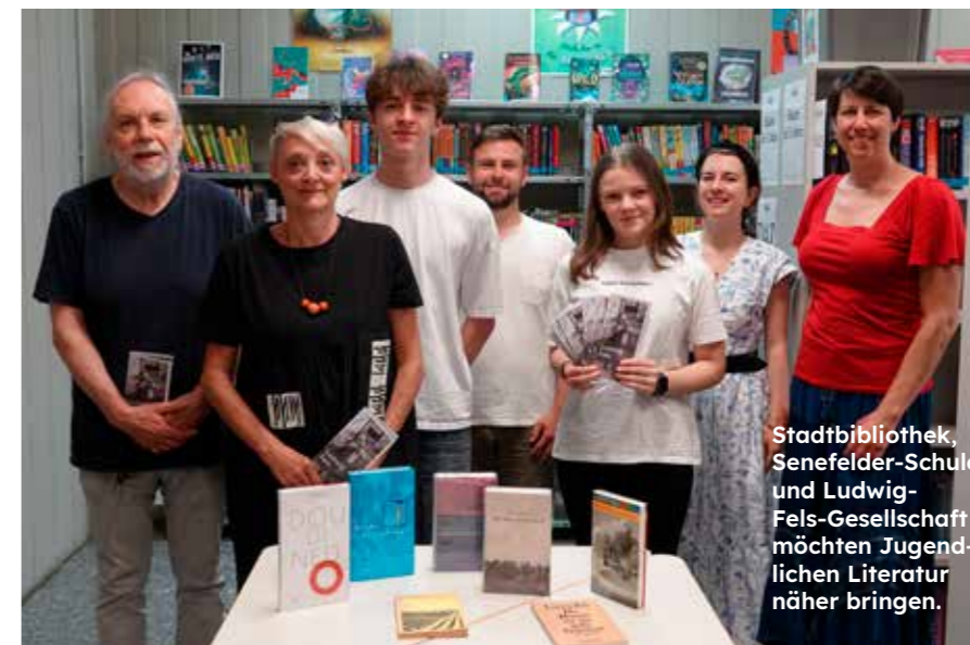
Stadtbibliothek, Senefelder-Schule und Ludwig-Fels-Gesellschaft möchten Jugendlichen Literatur näher bringen.