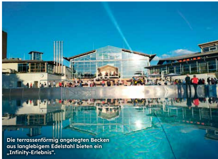
Die terrassenförmig angelegten Becken aus langlebigem Edelstahl bieten ein „Infinity-Erlebnis“.