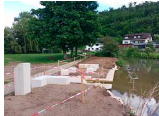
Die neue Wassertretanlage am Möhrenbach lädt künftig an heißen Sommertagen zu einer Abkühlung ein.

Baukosten // Wassertretbecken Möhren: 22.000 €