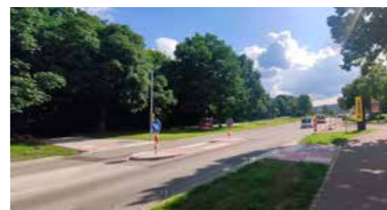
Die Überquerungshilfe beim E-Center bietet Fußgängern und Fahrradfahrern mehr Sicherheit.